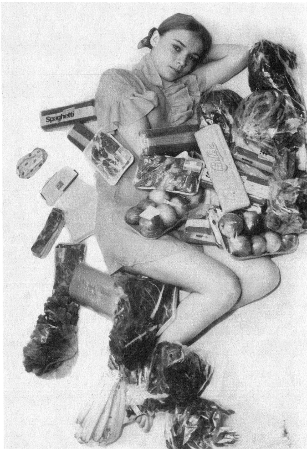
4 Vive la mort (Francis Reusser), photo de plateau.