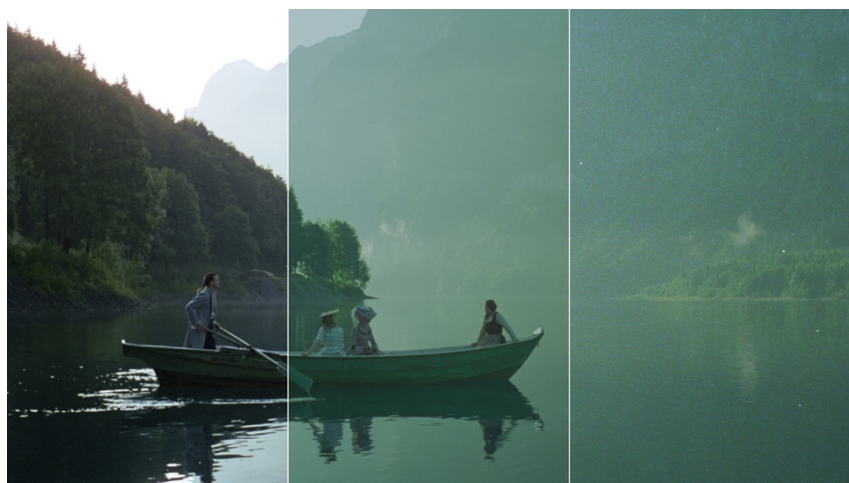
Légende : du scan (à droite) à la restauration (au milieu) et au calibrage des couleurs en HDR

D'autre part, la salissure des images a représenté une difficulté de grande ampleur. Le film comportait de nombreux points blancs minuscules qu'il a fallu enlever, surtout compte tenu du projet d'étalonnage des couleurs en HDR – chaque petit point blanc aurait comme enfoncé une épingle dans l'œil du spectateur. Pour faire disparaître les points blancs, plusieurs semaines de travail manuel ont été nécessaires.