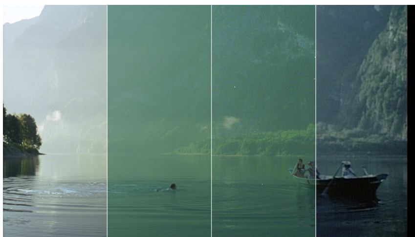
Légende: quatre étapes avant l'image finale