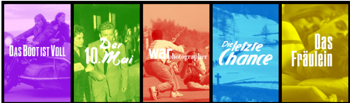
Figure : conception du visuel « filmo »

Grâce au branding, l'édition est identifiable en tant que collection. Chaque titre de film est retravaillé typographiquement pour filmo et doté d'un nouveau visuel (poster). De surcroît, un jeu de couleurs a été développé et attire le regard par les éléments graphiques.