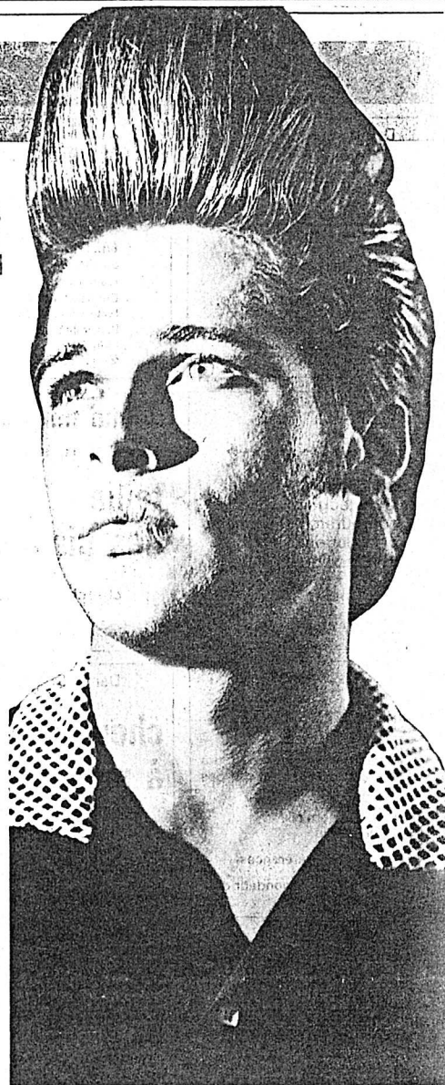
La somptueuse banane de «Johnny Suede».